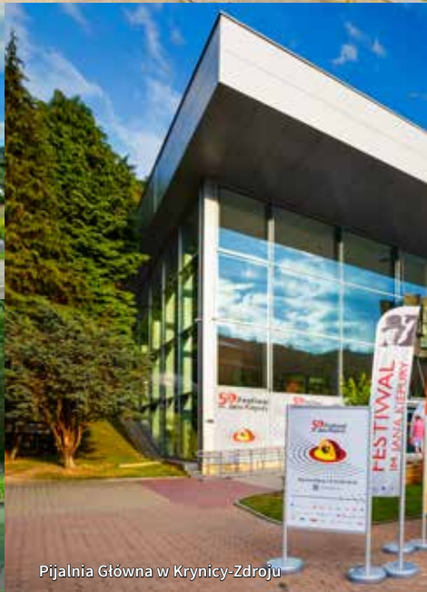
Pijalnia Główna w Krynicy-Zdroju