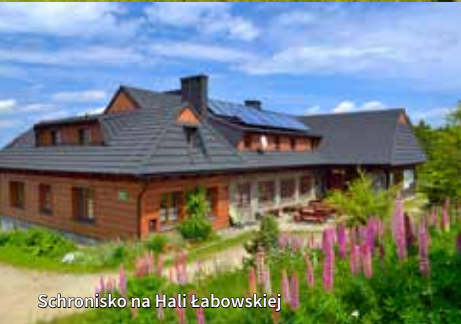
Schronisko na Hali Łabowskiej