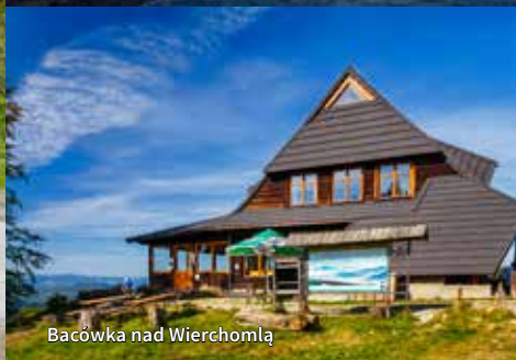
Bacówka nad Wierchomlą