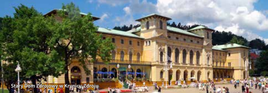
Stary Dom Zdrojowy w Krynicy-Zdroju