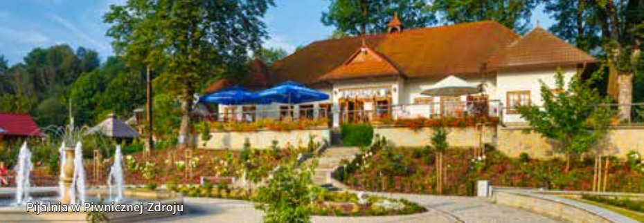
Pijalnia w Piwnicznej-Zdroju