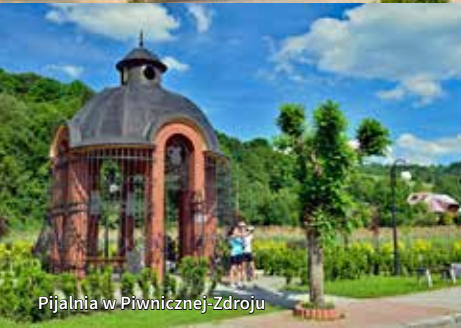
Pijalnia w Piwnicznej-Zdroju