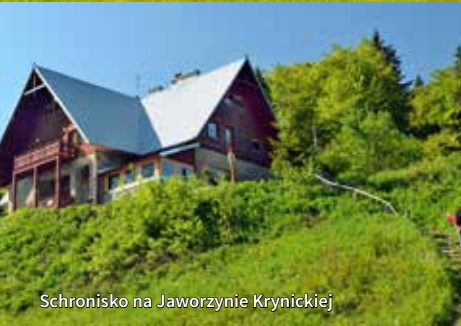
Schronisko na Jaworzynie Krynickiej