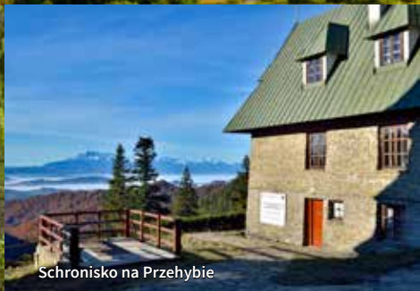
Schronisko na Przehybie