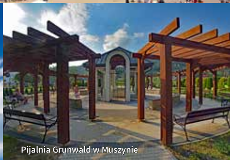
Pijalnia Grunwald w Muszynie