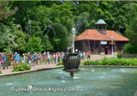
Pijalnia Jana w Krynicy-Zdroju