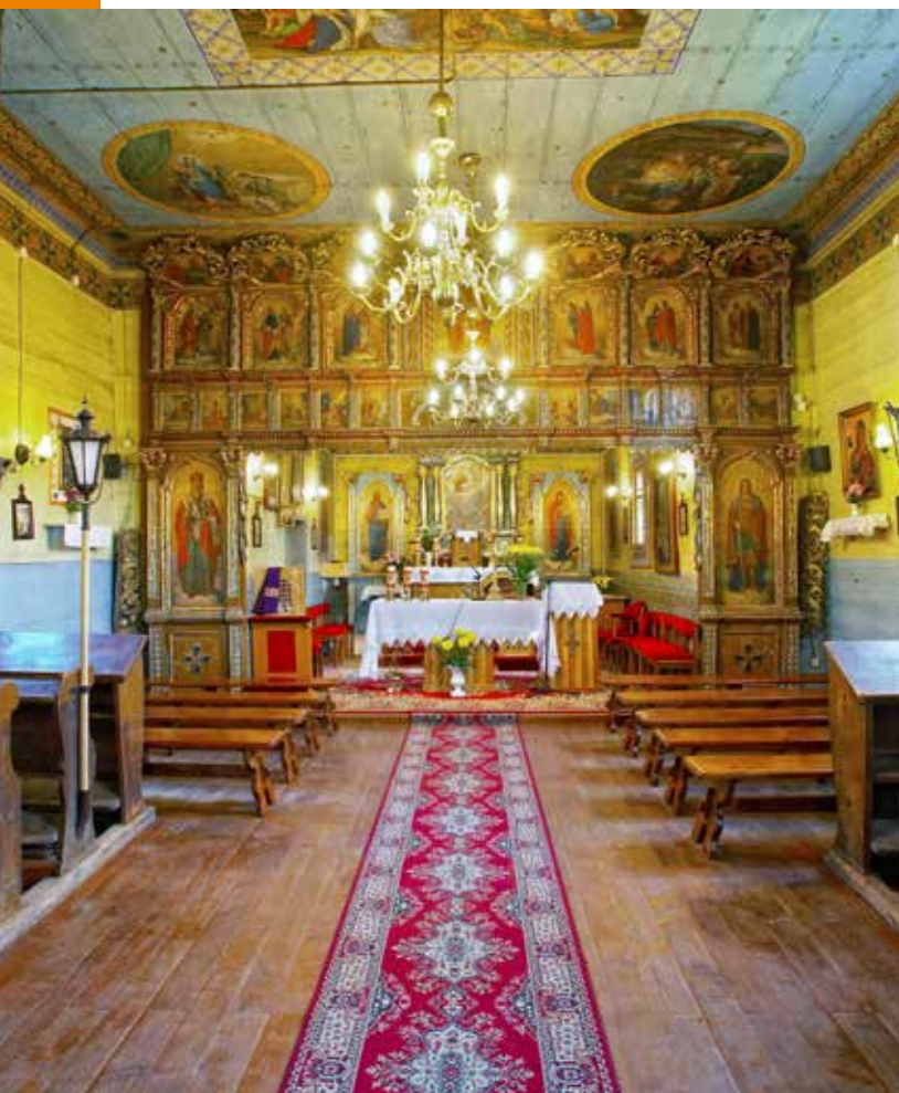
Cerkiew w Roztoce Wielkiej

Cerkiew greckokatolicka pw. św. Michała Archaniola w Wierchomli Wielkiej zbudowana w 1821 r. w miejsce spalonej starszej świątyni. Trójdzielny układem i zwieńczeniami nawiązuje do architektury