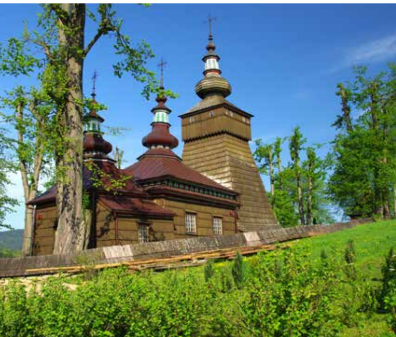
Cerkiew w Andrzejówce

z XVIII w. Na uwagę zasługują ikony Matki Boskiej i św. Mikołaja oraz kilkusetletnie obręcze metalowe, a także dwa młotki, którymi dzwonią na trwogę i przy nabożeństwach kościelnych. Ciekawostką jest „dzwon Ewy” – podwieszana