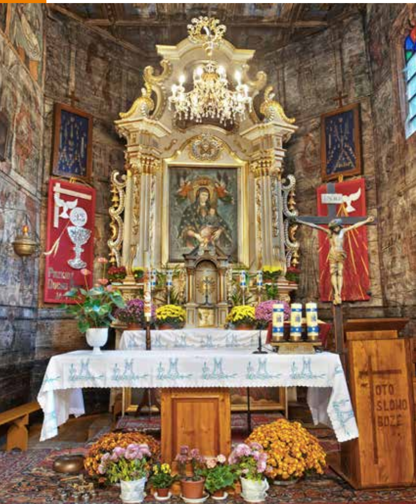
Kościół w Przydonicy

Matki Bożej, św. Jana Ewangelisty i św. Marii Magdaleny. Do kościoła prowadzi troje drzwi: jedne ostrołukowe z malowanymi tarczami herbowymi „Gierałt” i „Gryf” oraz malowaną kratownicą, drugie z wykrojem w trójliść zamknięty oślim grzbietem, a trzecie z wykrojem w ośli grzbiet z malowaną skośną kratą z rozetami na przecięciach i z napisem Paulus Carpentarius. Pod tym malowidłem widoczne jest pierwotne malowidło z 1527 r. o motywach zwierzęcych. W ołtarzu głównym umieszczony był łaskami słynący obraz Matki Boskiej z Dzieciątkiem – Pocieszenia, barokowy z XVII w., według trady-