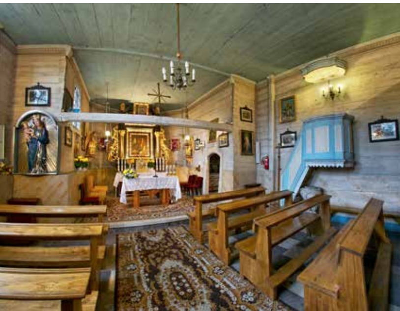
Kościół na górze Just

dań ludzi z okolic. Zawarł w nim m.in. informację, że Just – uczeń św. Świerada z niedalekiego Tropia – żył na górze „Łobzów”, gdzie zmarł i został pochowany w 1007 r. Tradycja mówi, że było to właśnie miejsce, na którym dziś stoi drewniany kościółek. Świątynia jest obiektem drewnianym najprawdopodobniej wy-