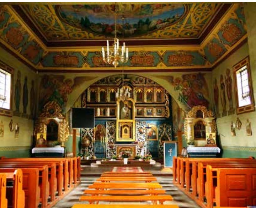
Cerkiew w Binczarowej

rii Panny Pokrownej z tego samego stulecia i Ukrzyżowania z XVIII lub XIX w. Na uwagę zasługuje także cenna polichromia z 1913 r. dzieła Bronisława Kmaka. Obecnie to kościół rzymskokatolicki pw. św. Stanisława Biskupa. Świątynię odnowiono w latach 2009-10.