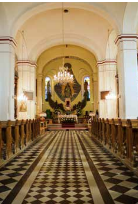
Kościół w Piwnicznej-Zdroju

św. Elżbiety, cztery ołtarze boczne z XVII i XVIII w. W kaplicy południowej późnobarokowy ołtarz z XVIII w., a w nim barokowy obraz Śluby Błogosławionej Kingi. Warto zwrócić uwagę na zabytkową ambonę, wielkie obrazy, rzeźby liturgiczne i tablicę upamiętniającą powstanie odsieczy wiedeńskiej. Z kościołem graniczy zabytkowy budynek starej plebanii z 1795 r. Patronką świątyni jest św. Elżbieta, ciotka św. Kingi oraz jej siostra Małgorzata.