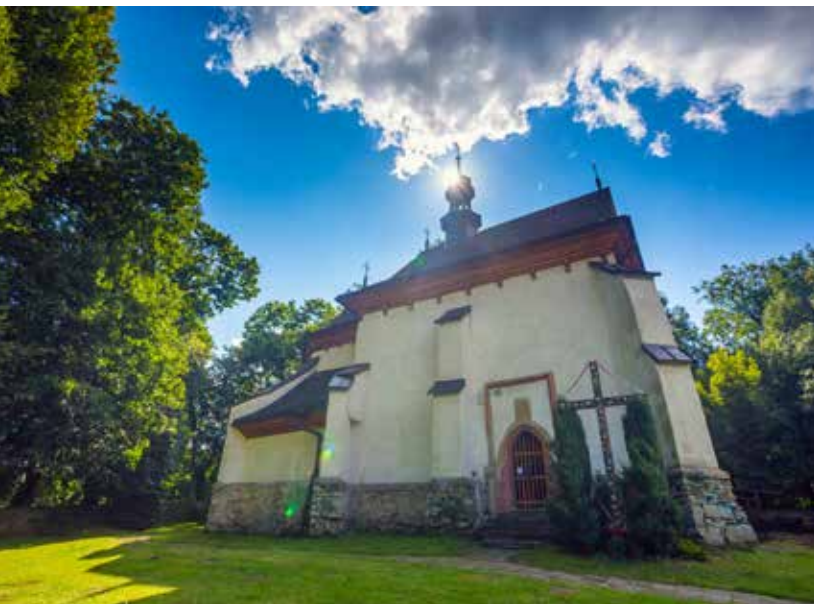
Kościół w Zbyszczach, fot. K. Bańkowski

sce zachowanych od czasu budowy w niezmienionym stanie. Obecnie na zachodniej ścianie kościoła zachowały się otwory strzelnicze, świadczące o obronnym charakterze gotyckiej budowli. Wewnątrz kamienna barokowa chrzcielnica, stalle gotyckie z XVI w. i ołtarz główny z XVIII stulecia z obrazem Matki Bożej Łaskawej oraz znajdującym