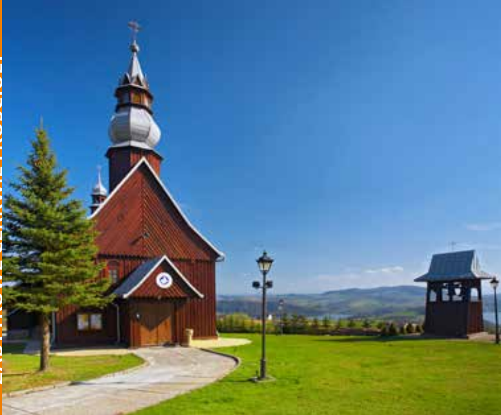
Kościół w Tabaszowej

Kościół pw. św. Mikołaja w Tabaszowej wzniesiono w 1753 r. w Tęgorozu. Do Tabaszowej przeniesiono go w 1982 r. To budowla konstrukcji zrębowej, o ścianach oszalowanych pionowo. Na szalunku ściany zamykającej prezbiterium w pierwszej połowie XIX w. namalowano Grupę