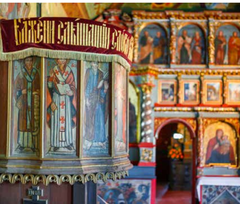
Cerkiew w Tyliczu

dowana w 1743 r. Do nawy przy ikonostasie przylegają dwa, charakterystyczne dla wschodniej architektury cerkiewnej pomieszczenia dla śpiewaków, tzw. kritoły, które nigdzie indziej na Łemkowszczyźnie nie występują. Obecnie pełnią one funkcje