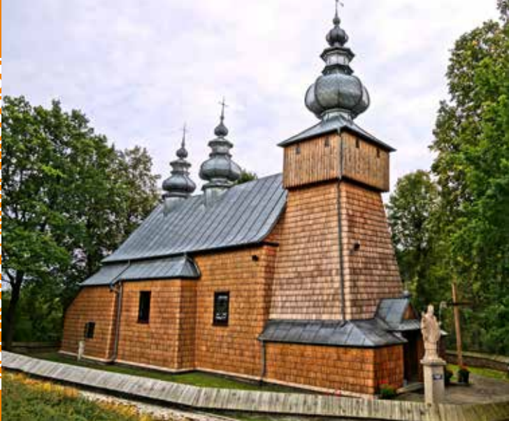
Cerkiew w Binczarowej

stas z drugiej połowy XVIII w. uzupełniony sto lat później – w miejscu Ostatniej Wieczery widnieje obraz Matki Boskiej Różańcowej – oraz kamienny ołtarz z 1967 r. z relikwiami św. Wojciecha. W późnobarokowych ołtarzach bocznych z XVIII w. znajdują się obrazy Najświętszej Ma-