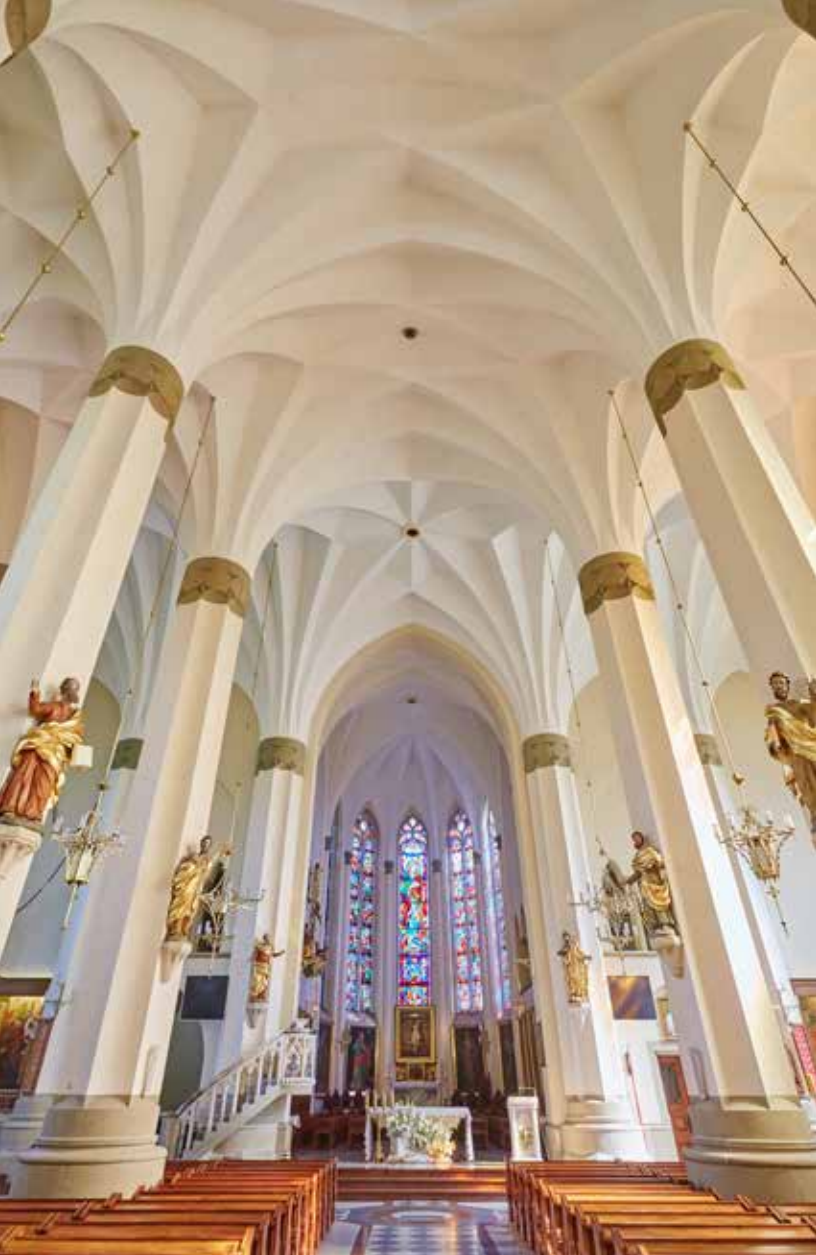
Bazylika w Grybowie

Bazylika Mniejsza pw. św. Katarzyny Aleksandryjskiej w Grybowie to neogotycki kościół z początku XX w. W głównym ołtarzu rzeźba Chrystusa na Krzyżu na tle płasko rzeźbionej panoramy Jerozolimy z połowy XVII w. Pierwszy kościół w Grybowie istniał już w XIV w. Był wzniesiony w stylu gotyckim z kamienia rzeczno-