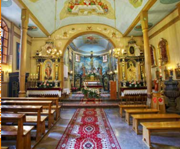
Kościół w Rożnowie

Kościół św. Wojciecha Biskupa Męczennika i Podwyższenia Krzyża Świętego w Rożnowie został poświęcony w 1705 r. Wnętrze świątyni nakrywa pozornie sklepienie kolebkowe, dekorowane ozdobnym malarstwem. Na suficie chóru zachowały się fragmenty polichromii późnorenesansowej z około 1688 r. Główny ołtarz to zespół figur barokowych z XVII w. – w centrum Jezus na krzyżu, po