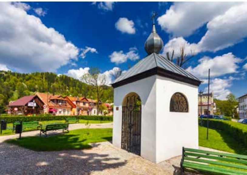
Kapliczka św. Nepomucena w Rynku w Muszynie

dzo ciężkie przewinienia. Niektóre stoją od wielu stuleci, a ich historia ginie w mrokach niepamięci. Nikt nie policzył sądeckich kapliczek, ale w każdej miejscowości jest ich przynajmniej kilka. Część to wyjątkowo malownicze obiekty. W czasie wędrówek warto zwrócić uwa-