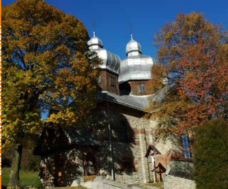
Cerkiew w Żegiestowie

Cerkiew pw. świętego Michała Archanioła w Żegiestowie dziś funkcjonuje jako kościół rzymskokatolicki pw. św. Anny. Nie jest to typowy przykład budownictwa cerkiewnego tych terenów. Została zbudowana na planie krzyża greckiego, z kamienia i cegły. Nawa, a właściwie skrzyżowanie nawy głównej z nawą poprzeczną, prezbiterium oraz babiniec zwieńczone są blaszanymi kopułami osadzonymi na wydłużonych drewnianych