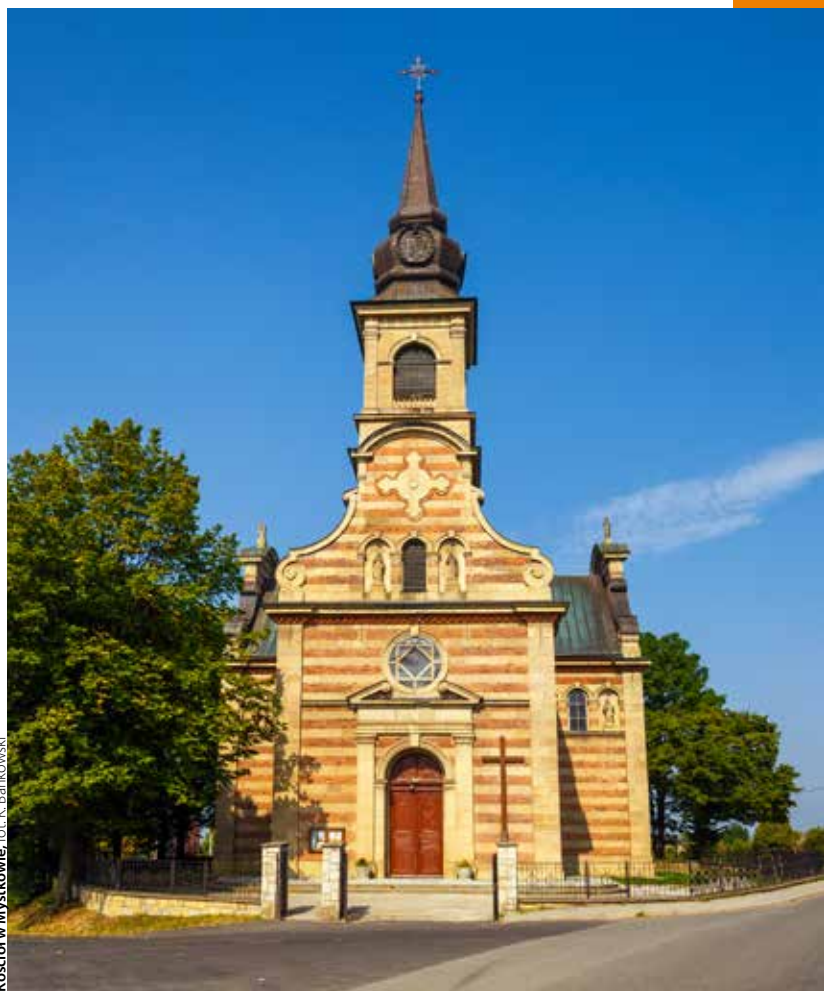
Kościół w Mystkowie

Kościół w Jazowsku powstał na początku XVIII w. Wybudowany w stylu późnobarokowym, murowany, jednonawowy. Świątynia ma trzy portale: jeden w stylu renesansowym z XVI w. i dwa z XVII stulecia. Wnętrze kościoła urządzone jest w stylu późnobarokowym. Na wyposażeniu drewniany złożony ołtarz główny (ok. 1726 r.). W centralnym miejscu słynący łaskami obraz Matki Boskiej Szkaplerznej. Warto zwrócić uwagę na usytuowany w nawie głównej ołtarz główny z 1621 r. w stylu manieryzmu niderlandzkiego, chrzcielnicę i ambonę z XVIII w. oraz obrazy z wcześniejszego stulecia.