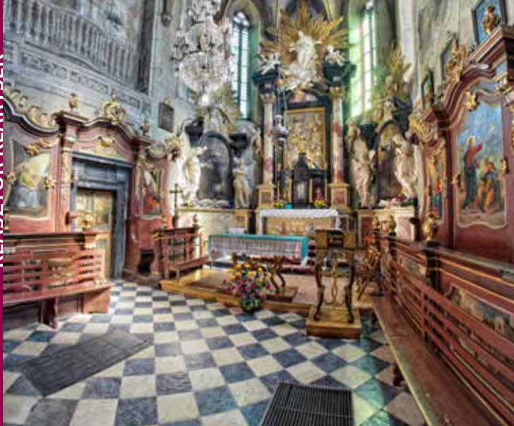
Klasztor w Starym Sączu, fot. K. Barikowski

gotycka chrzcielnica z XV w. w kształcie ośmiobocznego kielicha z dekoracją maswerkową. Z 1699 r. pochodzi zaś ołtarz główny autorstwa Baltazara Fontany wykonany z czarnego marmuru oraz stiuku. Jego