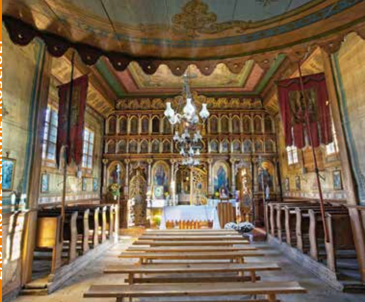
Cerkiew w Łosiu, fot. K. Bankowski

miu ikonach Deesis z apostołami z połowy XVII wieku, które znajdują się na parapecie chóru. Na teren cerkwi prowadzi drewniana brama-dzwonnica z początku XX wieku. Obecnie jest to kościół rzymskokatolicki.