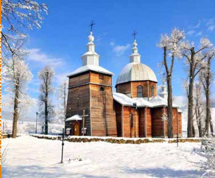
Cerkiew w Złociem, fot. A. Klimkowski

Drewniana cerkiew pw. św. Dymitra w Złociem powstała w latach 1867-1872 w stylu zachodnio-łemkowskim. Wewnątrz znajduje się klasycystyczno-rokokowy ikonostas z II połowy XIX wieku, polichromia figuralno-ornamentalna z 1873 r., trzy ołtarze boczne w stylu rokokowym z XIX wieku, barokowy krucyfiks, barokowo-ludowy obraz Chrystusa u słupa pochodzący z XVIII w., ikona Ukrzyżowanie