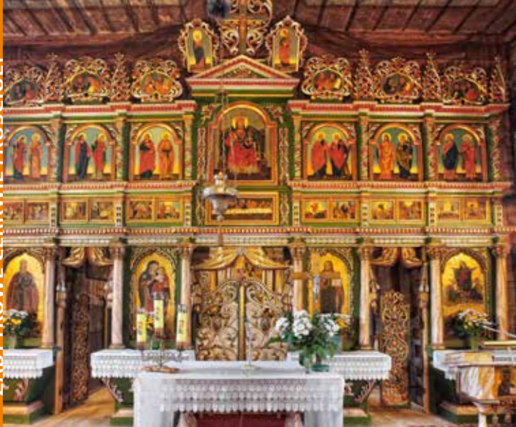
Cerkiew w Andrzejówce

Drewniana cerkiew pw. Zaśnięcia Bogurodzicy w Andrzejówce pochodzi z 1864 r. Wewnątrz znajduje się: późnobarokowy ołtarz z XVIII w. i widoczne nikielne ślady malowanego fryzu arkadowego oraz niekompletny ikonostas