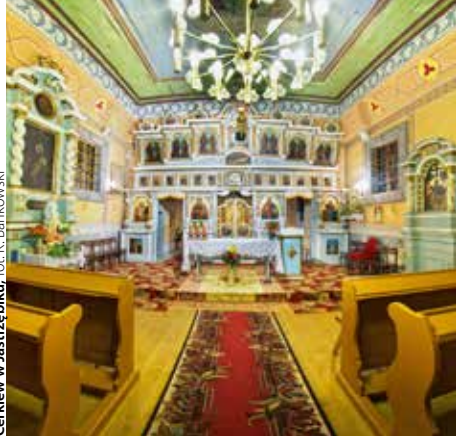
Cerkiew w Jastrzębiku

To budynek późnobarokowy, murowany z kamienia, otynkowany, jednonawowy z parą półkoliście zamkniętych kaplic. Prezbiterium i nawa nakryte są wspólnym dachem dwuspadowym, nad kaplicami bocznymi dachy kopulaste, na nich pięć wieżyczek baniastych z latarniami. Figuralna i ornamentalna polichromia wnętrza z 1942 r. wykonana w tradycji malarstwa ruskiego. Ołtarz główny w kształcie konfesji, murowany, klasycystyczny z 2. poł. XIX w. Górna część ikonostasu w tradycji klasycystycznej. Chór muzyczny o balustradzie tralkowej z XVIII/XIX w.