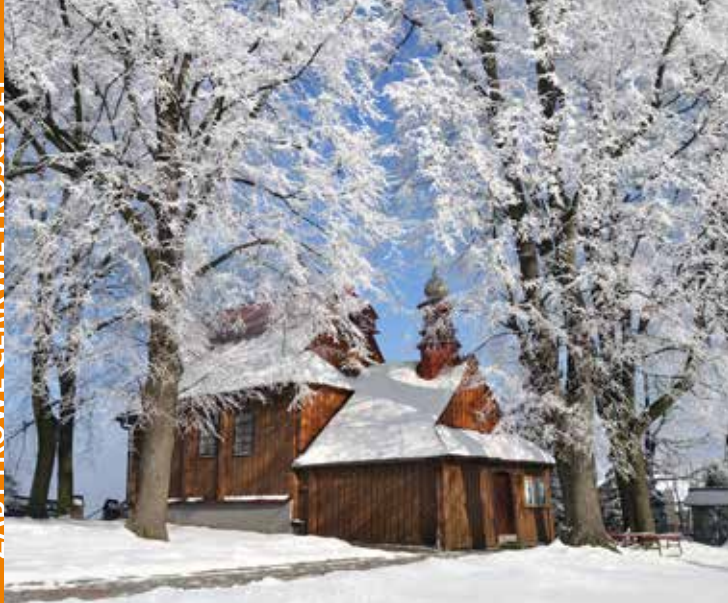
Kościół na górze Just, fot. A. Klimkowski

Legenda głosi, że kościół pw. Narodzenia Najświętszej Marii Panny na górze Just w Tęgorozy stoi w miejscu, gdzie swą pustelnię miał św. Just – zakonnik z przełomu IX i X w. Żyjący na przełomie XVI i XVII w. Marcin Baroniusz z Jarosławia napisał życiorys pustelnika, ale, jak sam powiedział, jedynie na podstawie opowia-