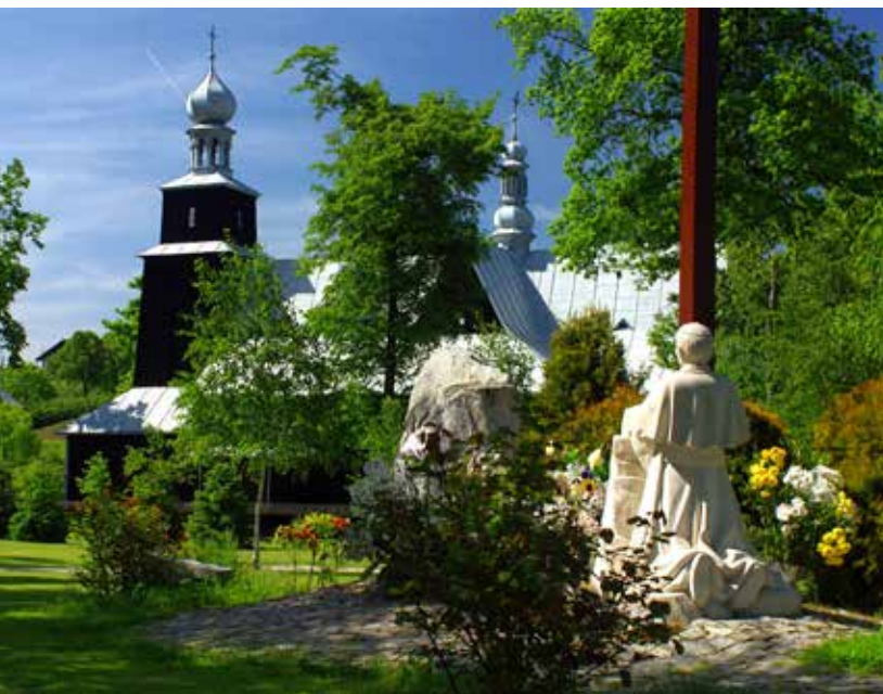
Kościół w Ptaszkowej

Tylko w kruchcie południowej zachowały się fragmenty starszych malowideł barokowo-ludowych ze scenami starotestamentowymi z 1795 r., a nawet resztki malowideł patronowych z XVI wieku. We wnętrzu dominuje ołtarz główny wykonany w tradycji późnobarokowej w 1864 r. z obrazem Matki Boskiej z Dzieciątkiem, ufundowany przez Michała Stadnickiego w 1734 r. Oprócz niego są tu też dwa małe barokowe ołtarze boczne. W lewym znajduje się płaskorzeźba Serca Pana Jezusa, w prawym gotycka rzeźba Matki Boskiej z Dzieciątkiem „ze słonecznikiem” z około 1420 r. Najcenniejszym zabytkiem jest płaskorzeźba Modlitwa w Ogrojcu dłuta Wita Stwosza z 1490 r. Do najstarszych elementów wyposażenia kościoła należy również chrzcielnica z 1506 r. Cennymi rzeźbami są dwa krucyfiksy z XVIII w. Warto zobaczyć także rokokowy feretron umieszczony w wieży na ścianie południowej z figurą Najświętszej Marii Panny Niepokalanie Poczętej z drugiej połowy XVIII w.