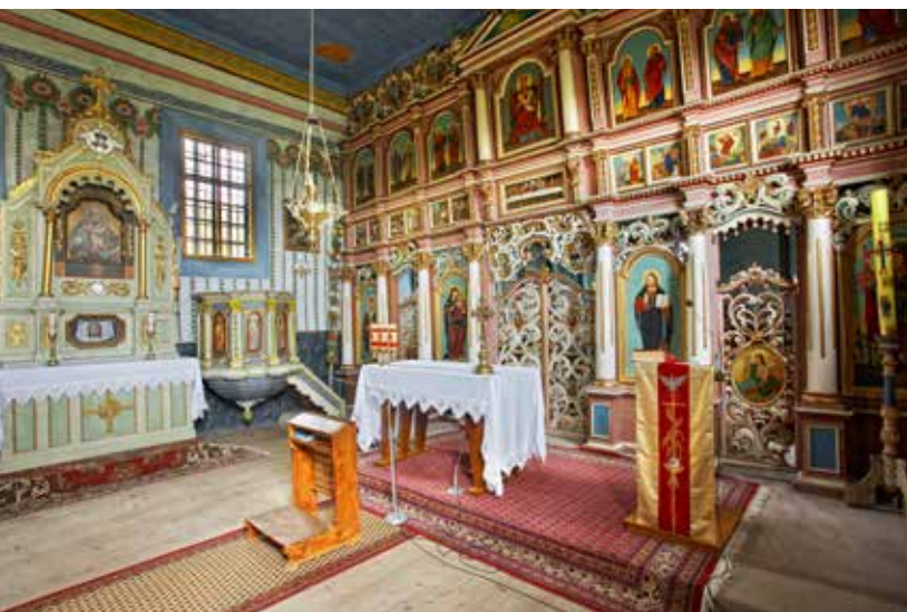
Cerkiew w Leluchowie

znajduje się dawne wyposażenie cerkiewne z kompletnym ikonostasem rokokowo-klasycystycznym, a także zachowała się piękna, bogata polichromia z 1935 r. wykonana przez Mikołaja Galanka. Świątynia reprezentuje typ zachodniołemkowskiego budownictwa cerkiewnego. Obecnie użytkowana jako kościół filialny parafii rzymskokatolickiej Matki Bożej Anielskiej w Nowej Wsi.