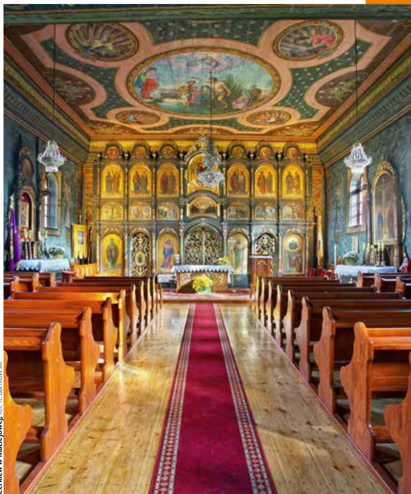
Cerkiew w Maciejowej

znajduje się drewniana dzwonnica. We wnętrzu świątyni zachował się kompletny ikonostas, neobarokowe ołtarze oraz polichromia wykonana przez Feliksa Bogdańskiego. Na uwagę zasługuje wisząca w nawie ikona z XVII w. przedstawiająca Chrystus w Jordanie, natomiast w babińcu przedstawienie Chrystusa Nauczającego. Obydwa obrazy pochodzą z wyposażenia starszej świątyni z Maciejowej. Warto też obejrzeć kamienną gotycką chrzcielnicę. Obecnie cerkiew użytkowana jest przez kościół katolicki. Obecnie pełni rolę kościoła filialnego parafii rzymskokatolickiej.