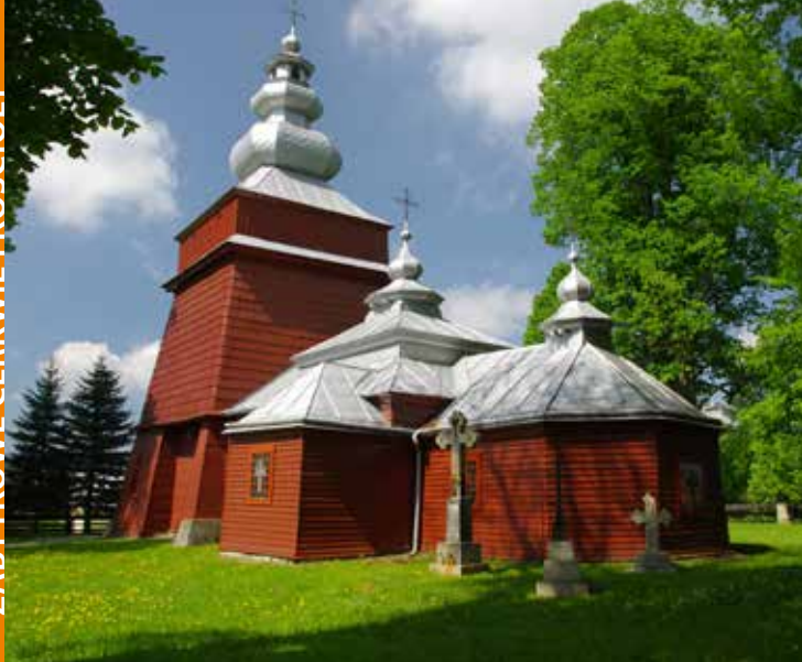
Cerkiew w Tyliczu

rzymskokatolicki pw. Matki Boskiej Częstochowskiej. W pobliżu znajduje się cmentarz, na którym zachowało się kilka starych nagrobków.