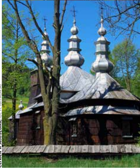
Cerkiew w Jastrzębiku

Drewniana cerkiew pw. św. Łukasza w Jastrzębiku pochodzi z I połowy XIX wieku. Wewnątrz jest polichromia ornamentalna z 1806 r. oraz dziewiętnastowieczny ikonostas barokowo klasycystyczny z XVIII-wiecznymi ikonami. W ikonostasie znajduje się rzadko spotykana ikona Chrystusa w Grobie. Jedyłą dokładnie datowaną, wykonaną w 1775 r. w stylu barokowo-ludowym jest Chrystus Dobry Pasterz. Wpływy bizantyjskie w wystroju widoczne są w sied-