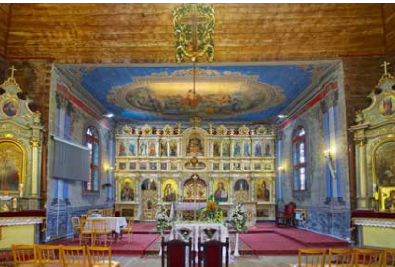
Cerkiew w Złociem

Cerkiew greckokatolicka pw. Opieki Najświętszej Maryi Panny w Łabowej pochodzi z 1784 r. Jest najstarszą świątynią na zachodniej łemkowszczyźnie. Została ufundowana przez rodzinę Lubomirskich.