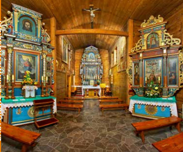
Kościół w Moszczenicy Niższej

zorne sklepienie kolebkowe oraz gotycki obraz św. Zofii z córkami z 1480 r., późnogotycki krucyfiks z XVI w. i późnorenesansowy ołtarz główny z XVII w. z barokowym obrazem św. Mikołaja.