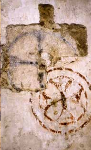
Kościół w Tropiu

Kościół pw. św. Andrzeja Świerada i Benedykta w Tropiu to obiekt murowany, w stylu romańskim, zbudowany według tradycji w 1090 r. obok pustelni. W prezbiterium widać resztki romańskiej polichromii z XII w. W ołtarzu znajduje się późnogotycki obraz Matki Bożej. Pozostałe elementy wyposażenia