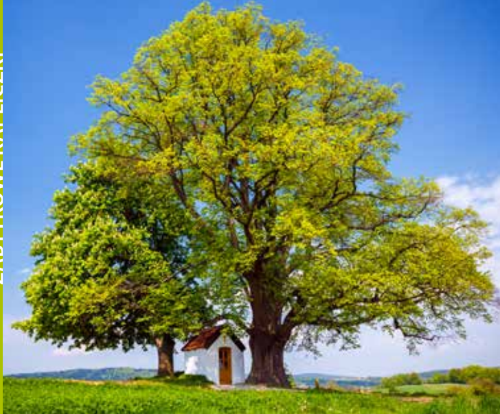
Kapliczka na Gliniku w Przydonicy