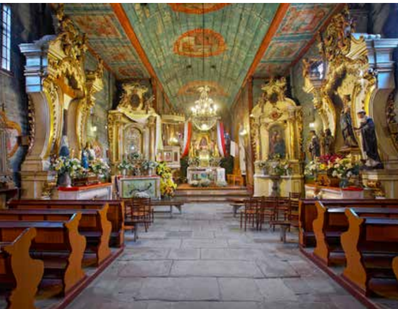
Kościół w Chomranicach, fot. K. Bankowski

bi słynący łaskami obraz Matki Boskiej Chomranickiej. Po północno-wschodniej stronie obiektu znajduje się wolno stojąca dzwonnica z 1692 r. Kościół jest otoczony kamiennym murem z I poł. XIX wieku. W jego obwodzie znajduje się 14 kaplic ze Stacjami Drogi Krzyżowej.