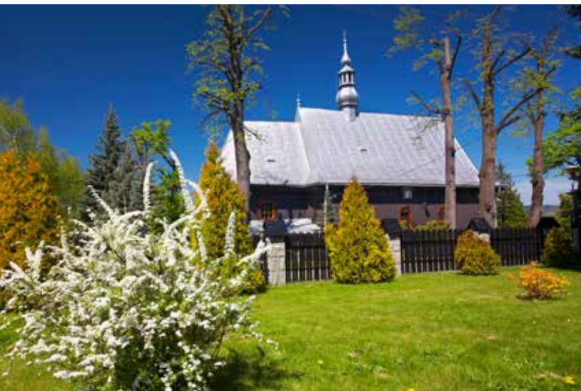
Kościół w Rożnowie