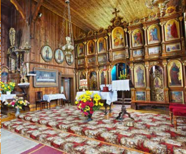
Cerkiew w Czarny

ską Pokrow, pochodzący z cerkwi w Izbach. Na ścianie południowej znajduje się barokowy ołtarz z obrazem przedstawiającym św. Mikołaja.