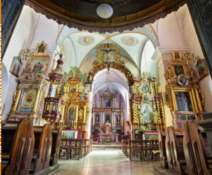
Kościół w Starym Sączu

Kościół pw. św. Elżbiety Węgierskiej Wdowy w Starym Sączu powstał w drugiej połowie XIV wieku, murowany z kamienia i cegły. Wewnątrz na uwagę zasługuje pseudobarokowy ołtarz główny z drugiej połowy XIX w. z posągami śś. Piotra i Pawła oraz obrazem