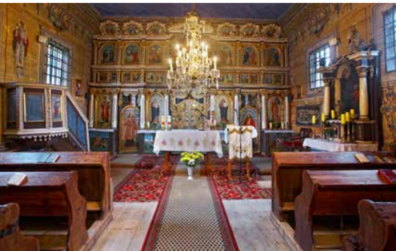
Cerkiew w Dubnem

mi latarniami. Wewnątrz zachowało się wyposażenie cerkiewne z XIX wieku. Na szczególną uwagę zasługuje rokokowo-klasycystyczny ikonostas z sześcioma ikonami z 1895 r. autorstwa Antoniego Bogdańskiego, przedstawiającymi figuralne postacie świętych: św. Mikołaja, św. Michała, Matki Boskiej z dziećmi, Chrystusa Nauczającego, św. Szczepana i Wawrzyńca i Chrystusa modlącego się w Ogrójcu. Najcenniejszym zabytkiem w cer-