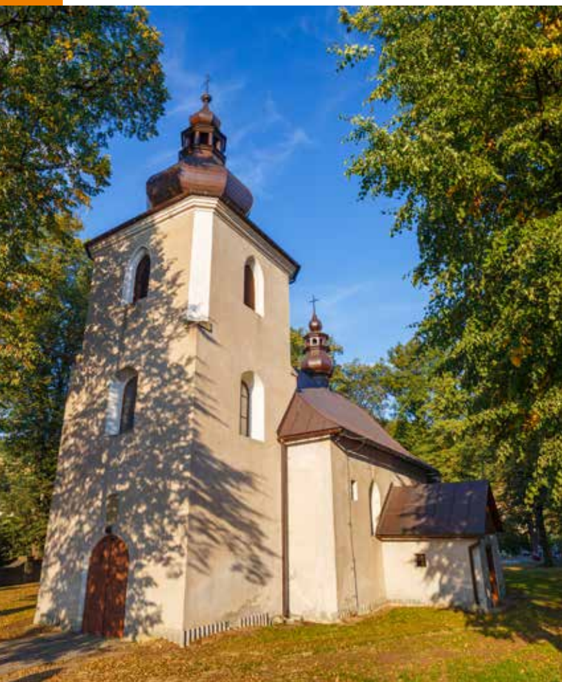
Kościół w Kamionce Wielkiej

wa Łokietka w latach 1320-1326. W 1577 r. jednak przestała istnieć, by funkcjonować znów cztery lata później. Najstarszą istniejącą do dzisiaj budowlą jest kaplica cmentarna pw. św. Izydora, która powstała w 1790 r. Neobarokowy kościół z kamienia i cegły pod wezwaniem św. Filipa i Jakuba został zbudowany w latach 1905-1910. Świątynia jednonawowa na planie krzyża, z prezbiterium zamkniętym półkoliście i kaplicą, a od frontu wieża. W niej trzy dzwony o tonażu 1200 kg. Wewnątrz neogotycki ołtarz główny powstały po 1910 r., a w nim łaskami słynący, przeniesiony ze starego