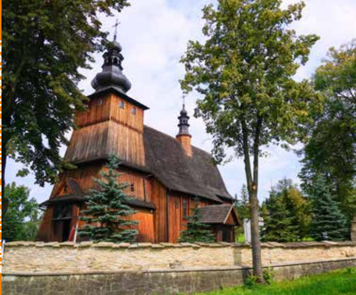
Kościół w Krużlowej

W 1520 r. Jan Pieniążek ufundował modrzewiowy kościół pw. Narodzenia NMP w Krużlowej . Wieś była własnością tej rodziny przybyłej tu w XIV w. Szczególny element wystroju świątyni to kasetonowy strop zdobiony podobnymi do wawelskich rozetami. Warto zwrócić uwagę na kamienną chrzcielnicę z 1486 r., ob-