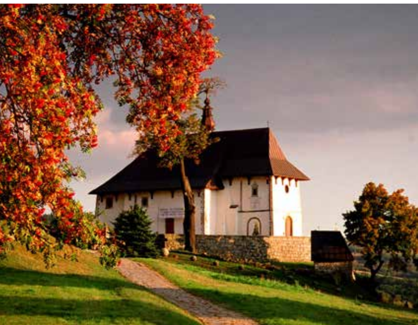
Kościół w Tropiu

(polichromia, epitafium) są rokokowe i barokowe. Przy kościółku jest pustelnia św. Andrzeja Świerada – kapliczka w miejscu, gdzie, jak głosi tradycja, mieszkał święty, żyjący w latach 980-1034. Obok niej są resztki prastarego dębu, który miał się rozpaść, aby dać schronienie pustelnikowi. W kościele znaj-