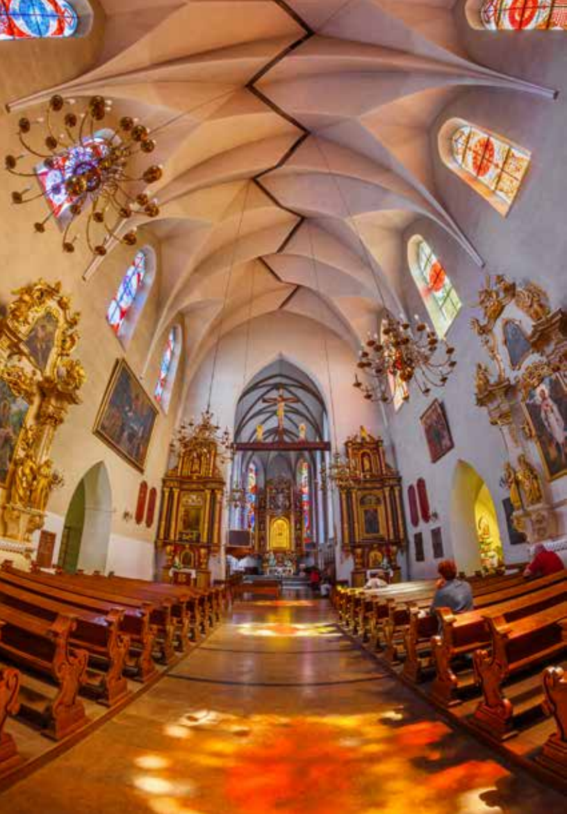
Bazylika w Nowym Sączu

w., ołtarze w nawie z obrazami św. Anny Samotrzec z XVII w. i Veraicon z XVIII w. Późnobarokowa ambona, chrzcielnica i organy oraz rokokowy krucyfiks na belce tęczącej, kilkanaście obrazów, feretronów i rzeźb z XVIII-XIX w. Obok kościoła, po jego południowo-zachodniej stronie, znajduje się murowana dzwonnica parawanowa z 1803 roku.