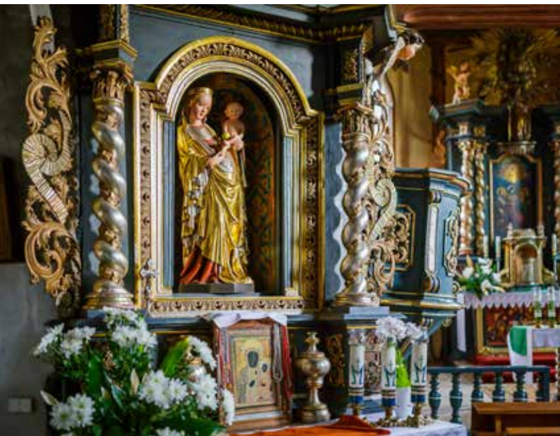
Kopia figury Matki Boskiej z Dzieciątkiem w Krużlowej

raz św. Anny z Maryją i rzeźbę Chrystusa Zmartwychwstałego. Kościół w Krużlowej posiadał również synną gotycką rzeźbę – Madonnę Krużłowską. Od kilku dziesięcioleci jest ona jednak własnością Muzeum Narodowego w Krakowie, a w krużłowskiej świątyni do 2000 r. znajdowała się jej wierna kopia.