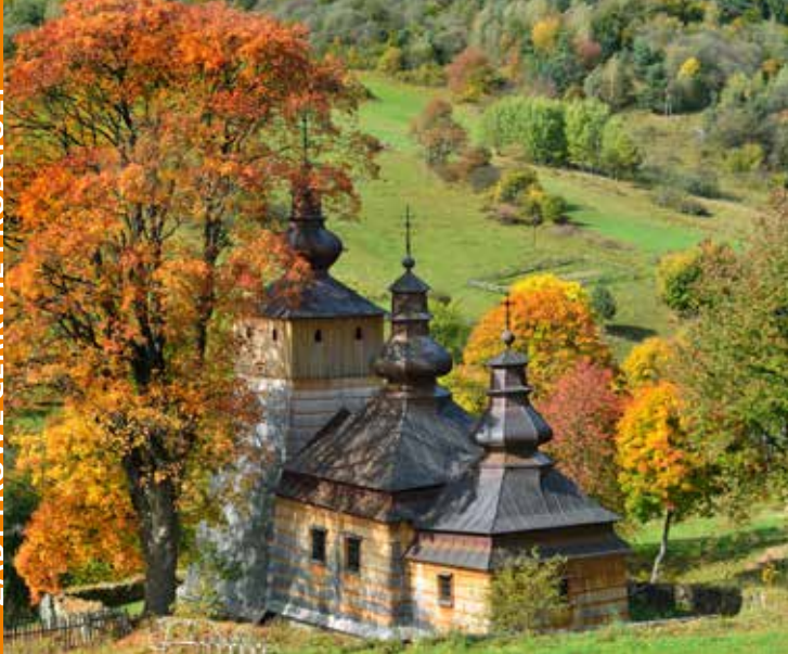
Cerkiew w Dubnem

Cerkiew pw. św. Michała Archanioła w Dubnem reprezentuje styl zachodniołemkowski. Została zbudowana w 1863 roku, na miejscu spalonej świątyni z 1673 roku. Jest to budynek drewniany, o konstrukcji zrębowej, jednonawowy, trójdzielny. Na pierwszym planie widoczna jest wieża słupowo-ramowa o ścianach pochyłych z pozorną izbicą usytuowaną w przedłużeniu babińca. Dach wieńczą trzy baniaste wieżyczki z pozornymi