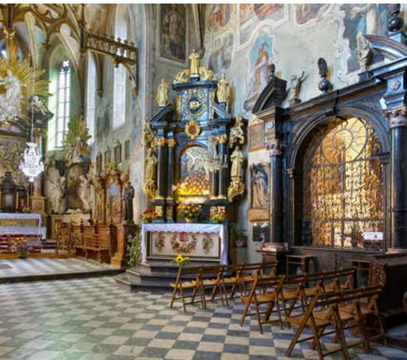
Klasztor w Starym Sączu

autorstwa są także ołtarze boczne. W przedsionku kościoła znajduje się gotycka chrzcielnica z XV w. w kształcie ośmiobocznego kielicha. Do kościoła przylega XIV-wieczna kaplica św. Kingi, otwarta od nawy