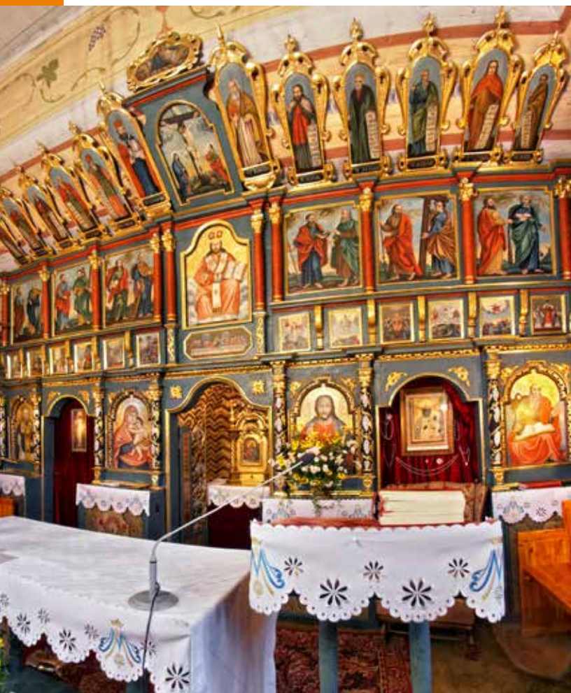
Cerkiew w Muszynie

Cerkiew greckokatolicka pw. św. Michała Archanioła we Floryncie nie posiada jednoznacznie określonego stylu, niewiele ma cech budownictwa cerkiewnego i klasycystycznego. Wybudowana z kamienia, otynkowana. Wewnątrz późnoklasycystyczny ikonostas z około 1875 r. i dwa późnobarokowe ołtarze boczne z XVIII w. W prawym ołtarzu obraz Ukrzyżowania z przełomu XVIII i XIX w. Warta uwagi także pseudobarokowa ambona z końca XIX w. Charakterystyczne są dwa dzwony świątyni – jeden z 1789 r., ozdobiony sceną Chrztu Chrystusa w Jordanie oraz wizerunkami Moj-