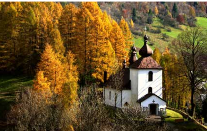
Cerkiew w Zubrzyku

Cerkiew w Zubrzyku budowano trzy razy. Pierwszą erygowano w 1646 r. Później świątynię budowano jeszcze dwukrotnie w 1717 i 1885 roku. Ta ostatnia, zachowała się do dziś. W połowie lat 40. XX wieku została zamieniona na kościół rzymskokatolicki pw. Podwyż-