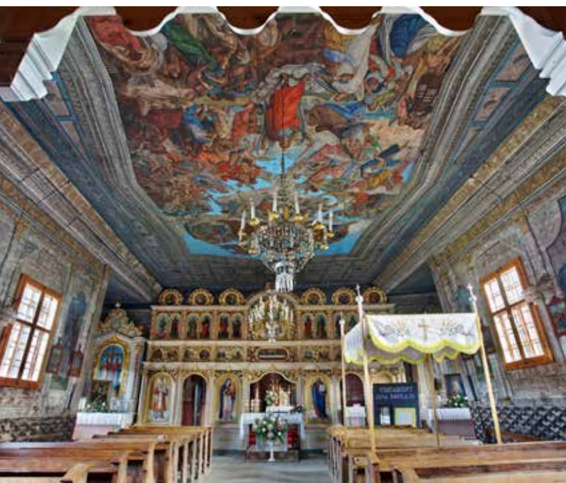
Cerkiew w Królów Górnij

wnątrz ikonostas z początku XX w., ołtarzyk z XVII w. z obrazem Matki Bożej z Dzieciątkiem, obok na ścianie rokokowa ikona św. Paraskewi z drugiej połowy XVIII w. Obecnie kościół rzymskokatolicki pw. Niepokalanego Serca NPM.