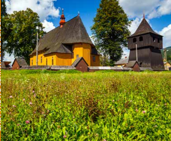
Kościół w Chomranicach

Kościół pw. Imienia Najświętszej Marii Panny w Chomranicach powstał w latach 1691-1692. Warto zwrócić uwagę na polichromię ornamentalną z 1767 r. w zakrystii. Wyposażenie kościoła to ołtarze rokokowe z XVIII w., barokowa ambona oraz kamienna chrzcielnica z XVIII w. Ołtarz główny zdo-