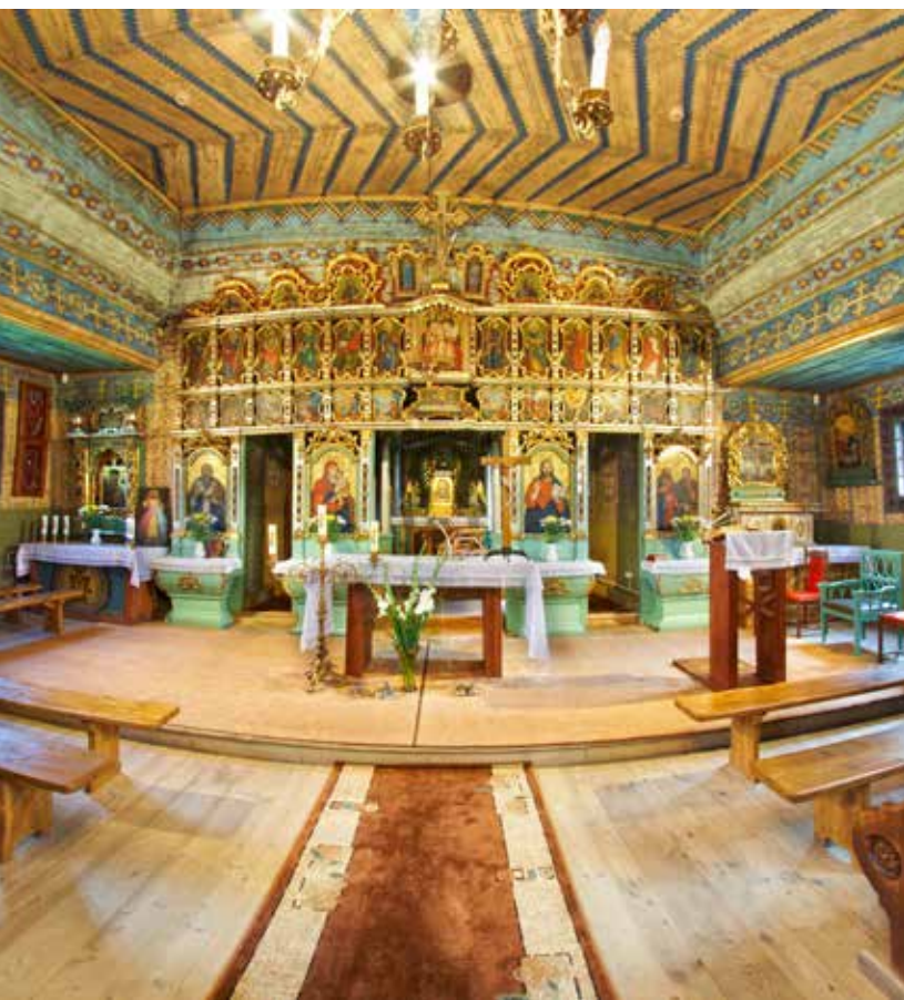
Cerkiew w Miliku

Drewniana cerkiew pw. św. Dymitra w Szczawniku z 1841 r. ma wewnątrz wystrój charakterystyczny dla sakralnego grekokatolickiego budownictwa byłego „klucza muszyńskiego”. Zachowany został późnobarokowy ołtarz boczny z 1729 r. z ikoną Przemienienia Pańskiego i obrazem Chrystusa w Grobie. Dzwon pochodzi z 1707 r., obra-