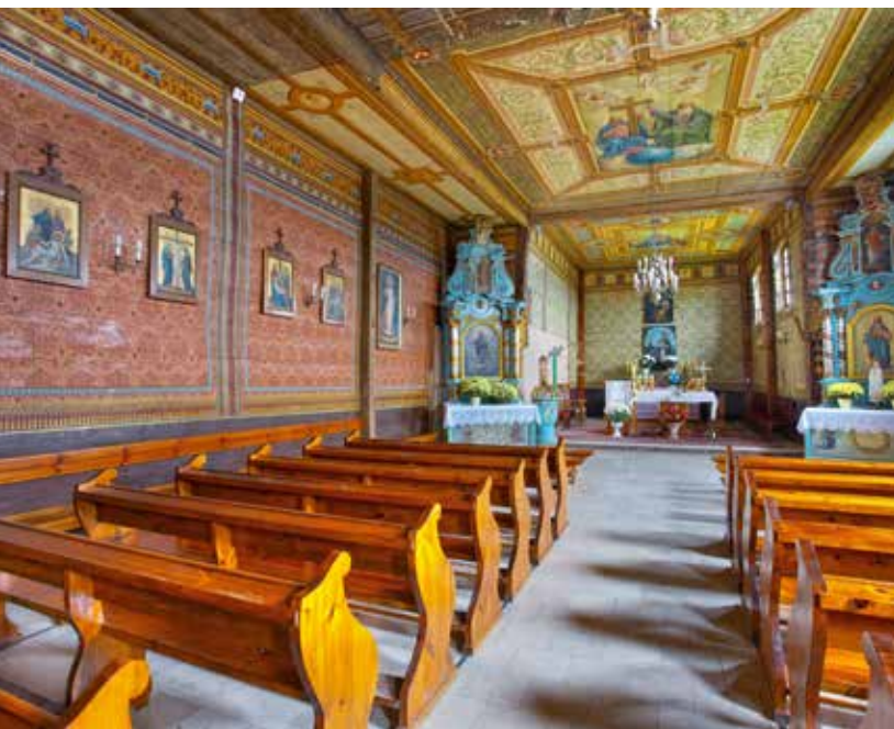
Kościół w Tabaszowej, fot. K. Bańkowski

Ukrzyżowania. Ściany zdołi malowana przez Adolfa Gućwę ornamentalno-figuralna polichromia z 1895 r. Rokokowe ołtarze pochodzą z XVIII w. W ołtarzu głównym barokowy obraz Matki Boskiej z Dzieciątkiem z XVIII w. oraz pochodzący z końca XIX w. wizerunek św. Mikołaja.