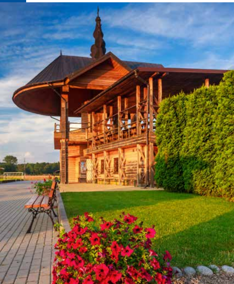
Ołtarz Papieski w Starym Sączu, fot. K. Bankowski

w Starym Sączu. Jest to dwukondygnacyjna drewniana konstrukcja, z podwyższoną częścią środkową, którą wieńczy dach z charakterystycznymi wieżyczkami. Mensa ołtarzowa pierwotnie wspierała się na dwóch słupach soli kamiennej, pochodzących z kopalni w Bochni, jednak, ze względu na niszczący wpływ warunków atmosferycznych, zostały one zastąpione granitowymi. Obecnie bloki sol-