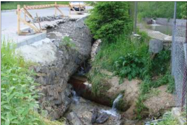
Skutki ostatnich powodzi w Tyliczu.