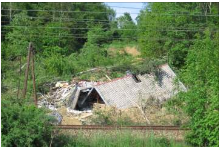
Skutki ostatnich powodzi w Jamnicy.