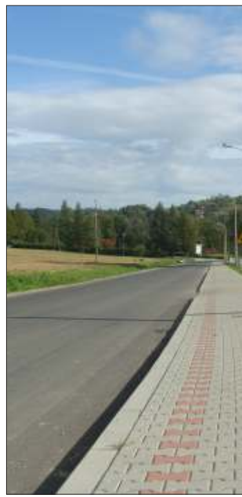
Droga Nawojowa-Żeleźnikowa Wielka-Łazy Biegonickie.

Do najważniejszych priorytetów na najbliższe lata władze powiatu zaliczają dalszą poprawę stanu dróg powiatowych oraz intensyfikację starań o przebudowę trasy krajowej z Krynicy przez Nowy Sącz do Brzeska, już dziś – na wzór Zakopianki – zwanej Kryniczanką.