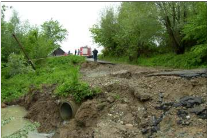
Skutki ostatnich powodzi w Gródku nad Dunajcem.